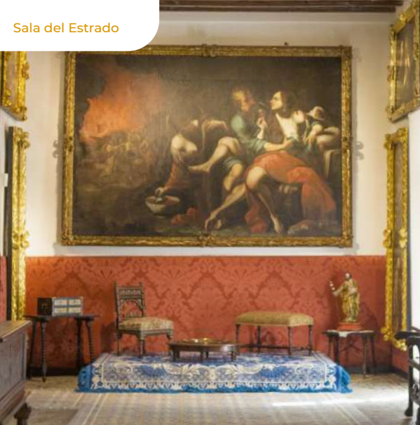
Sala del Estrado