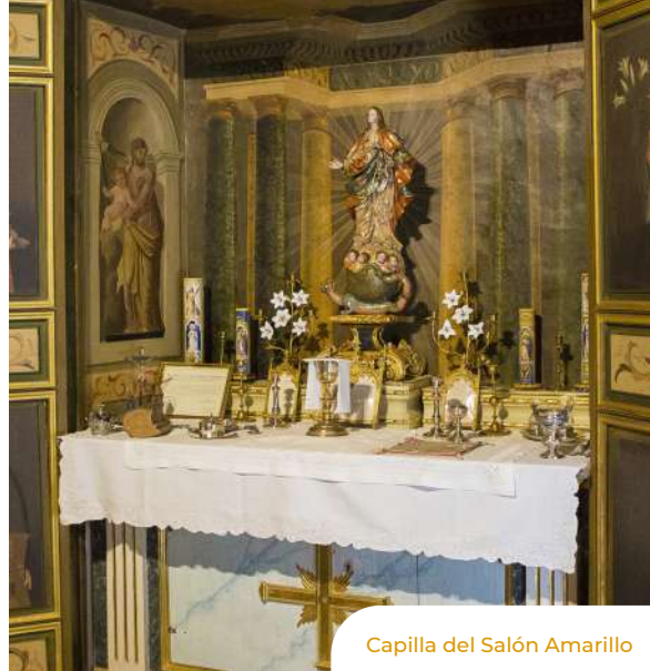
Capilla del Salón Amarillo