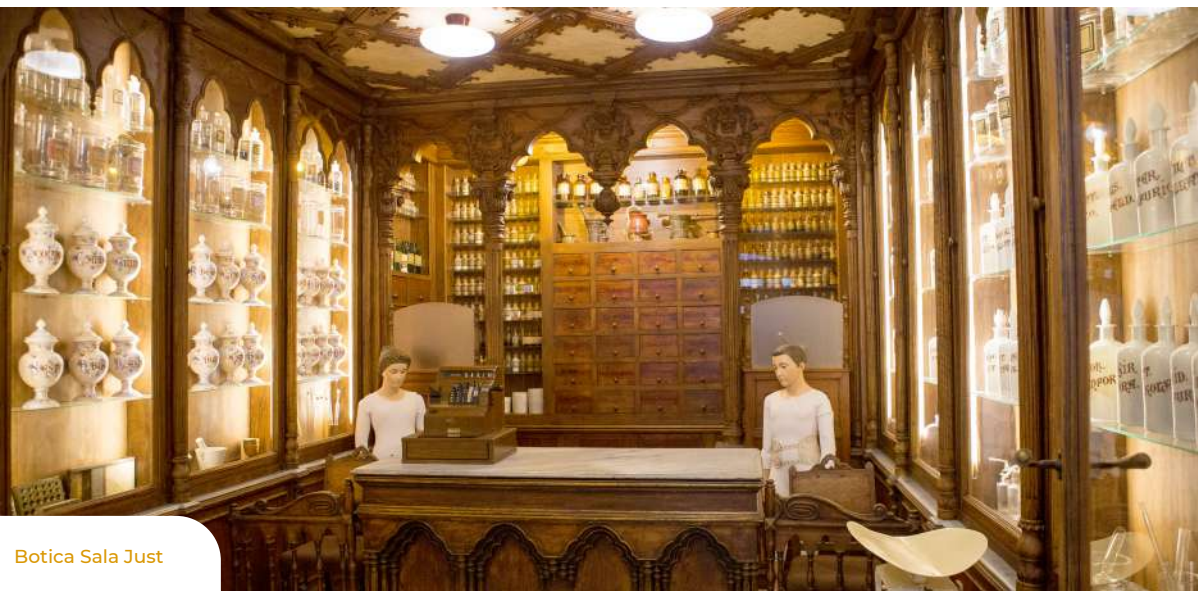
Botica Sala Just